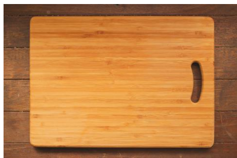
DESKA DO KROJENIA